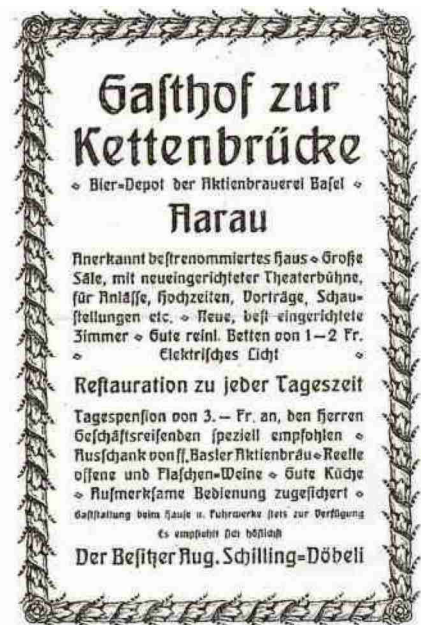
Das Inserat aus dem Jahr 1910.