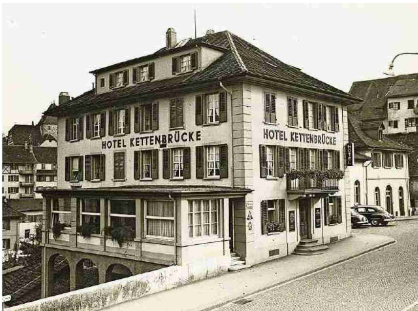
Eine undatierte Aufnahme aus dem Fotoalbum von Mina Frey.

Themen-Nr.: 571.146 Abo-Nr.: 3002313 Seite: 13 Fläche: 118'783 mm 2