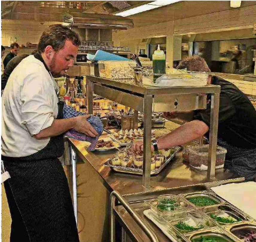
Bei der Vor-Eröffnungsfeier am Donnerstag herrschte Hochbetrieb in der Küche.

Themen-Nr.: 571.146 Abo-Nr.: 3002313 Seite: 31 Fläche: 88'487 mm 2