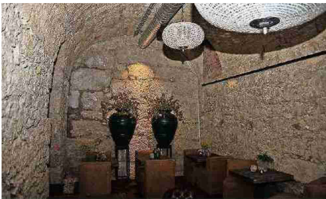
Memberclub statt Bierlager: der Gewölbekeller des Hotels.

Themen-Nr.: 571.146 Abo-Nr.: 3002313 Seite: 31 Fläche: 88'487 mm 2