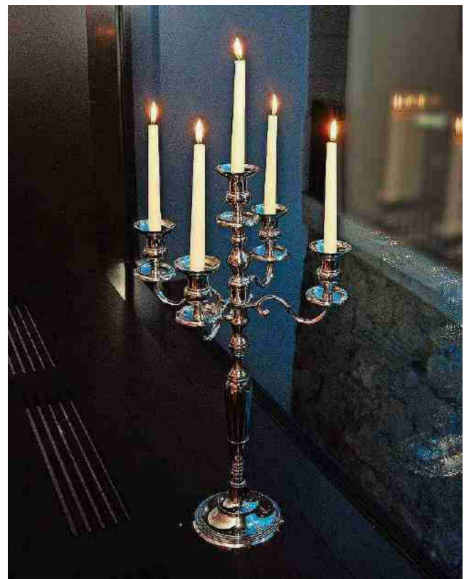
Schon der Eingangsbereich signalisiert stilvolles Ambiente.